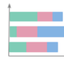
Stacked bar chart